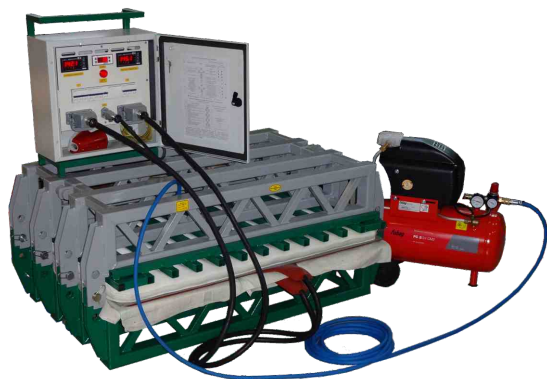
Вулканизатор конвейерный мобильный ВКМ-1000/750